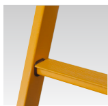
52 mm skridsikre trin